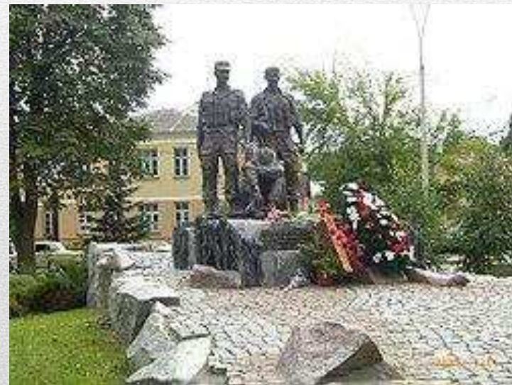
Меморіальний комплекс пам'яті воїнів України, полеглих в Афганістані, Київ