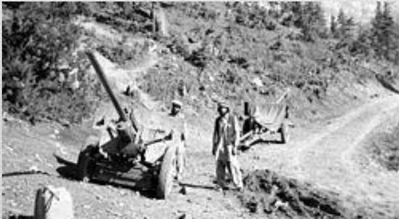
Афганські моджехеди з двома гарматами. 1984