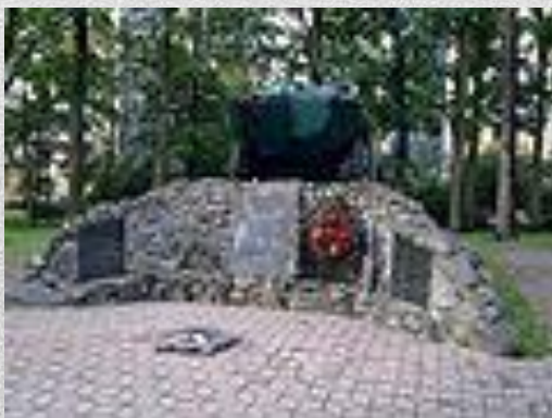
Пам'ятник воїнам- «афганцям» у Бучі