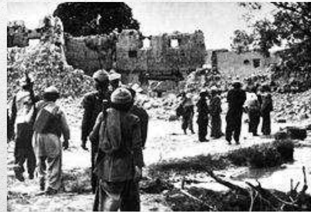
Селище моджахедів, зруйноване радянськими військами (1986)