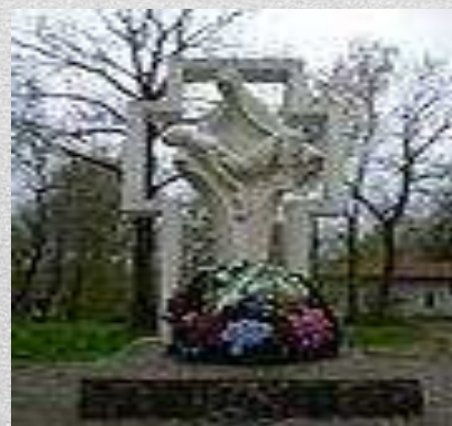
Пам'ятник воїнам, котрі загинули в Афганістані, у Дрогобичі