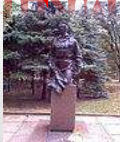
Пам'ятник воїнам - « афганцям » у Кривому Розі