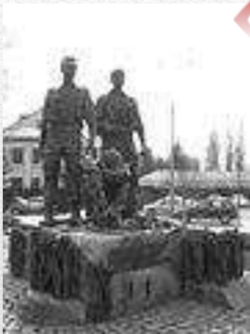
Пам'ятник воїнам - « афганцям » у Києві