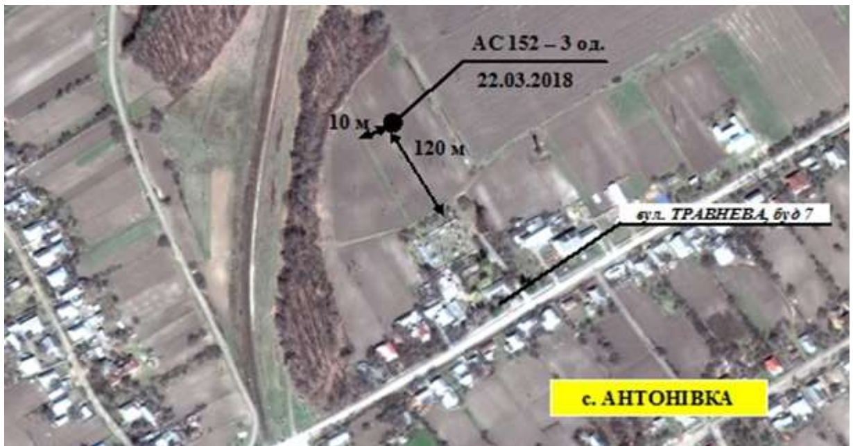
СХЕМА місця виявлення вибухонебезпечного предмета